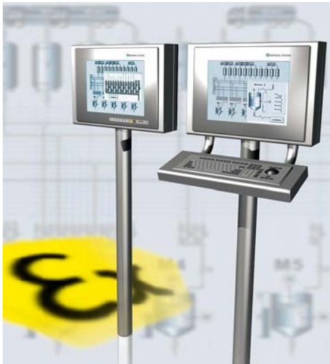
Bild 2: VisuNet kann sowohl als Remote-Lösung als auch als Panel PC eingesetzt werden.