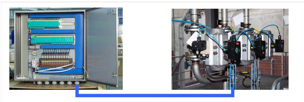
Bild 2: Einfacher eigensicherer Stromkreis mit zugehörigem Betriebsmittel, Leitung und Feldgerät