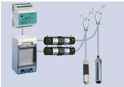
Bild 7: Komplet-Set zur kombinierten Aufstau- und Ölschicht-Überwachung.