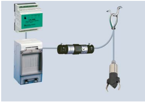
Bild 6: Schlammpegelsensor im Set mit Steuergerät, Wandbox, Kabelverbinder und Aufhängungsbeschlag.