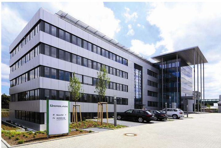
Bild 1: Pepperl+Fuchs Zentrale in Mannheim

Zur honorarfremen Verwendung für Redaktionen.